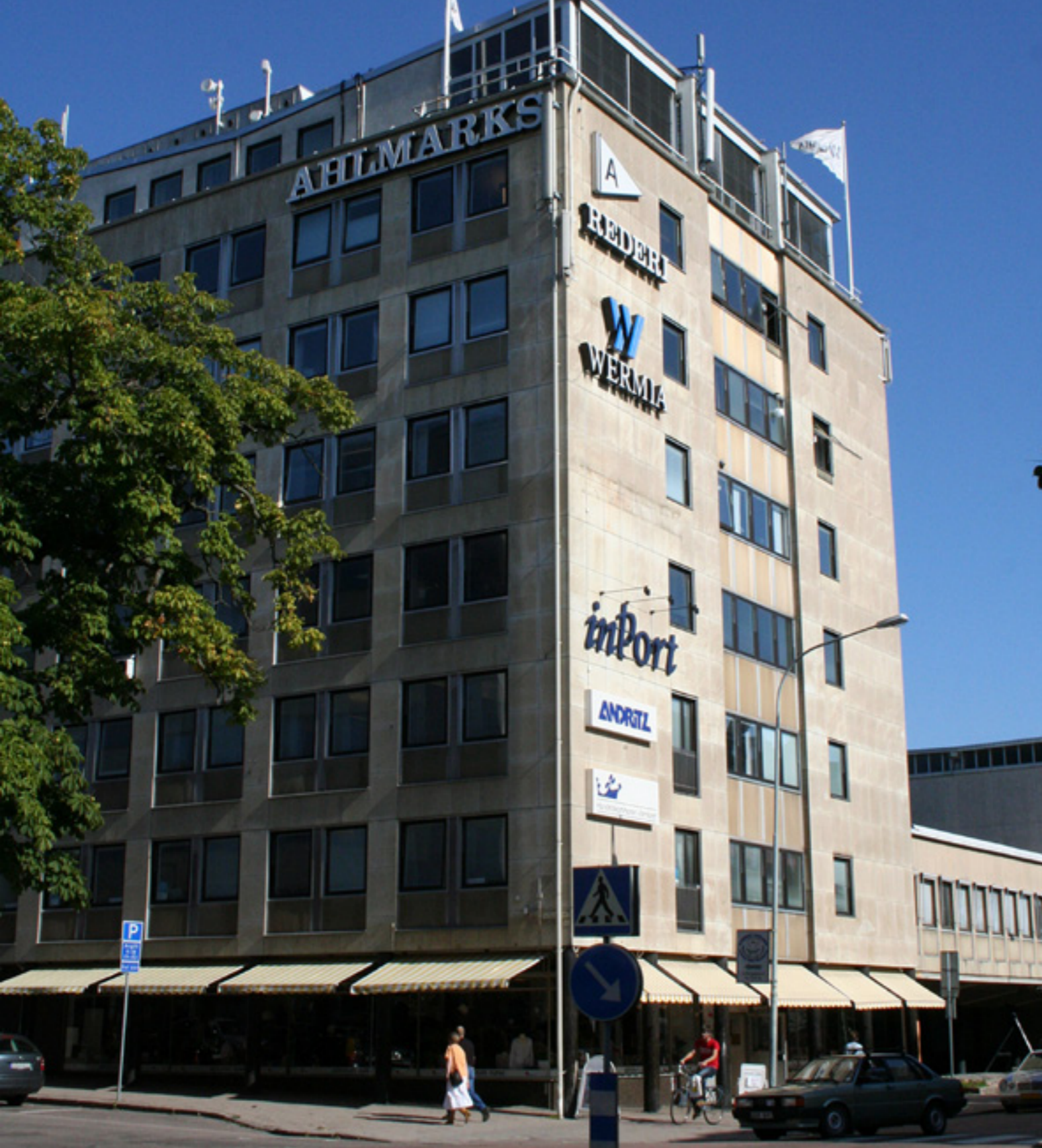
Wermia AB på plats i Ahlmarkshuset