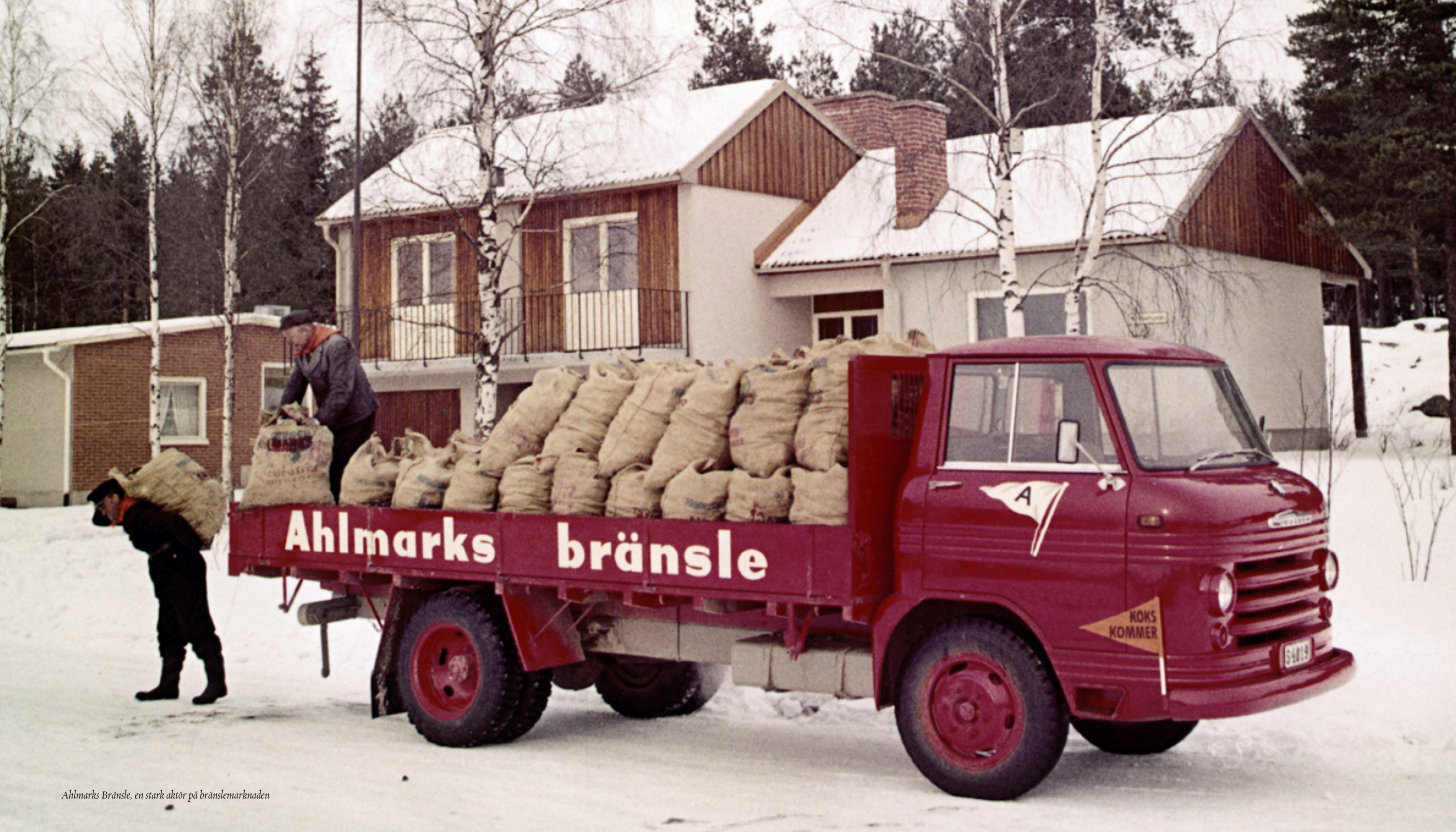
Ahlmarks Bränsle, en stark aktör på bränslemarknaden