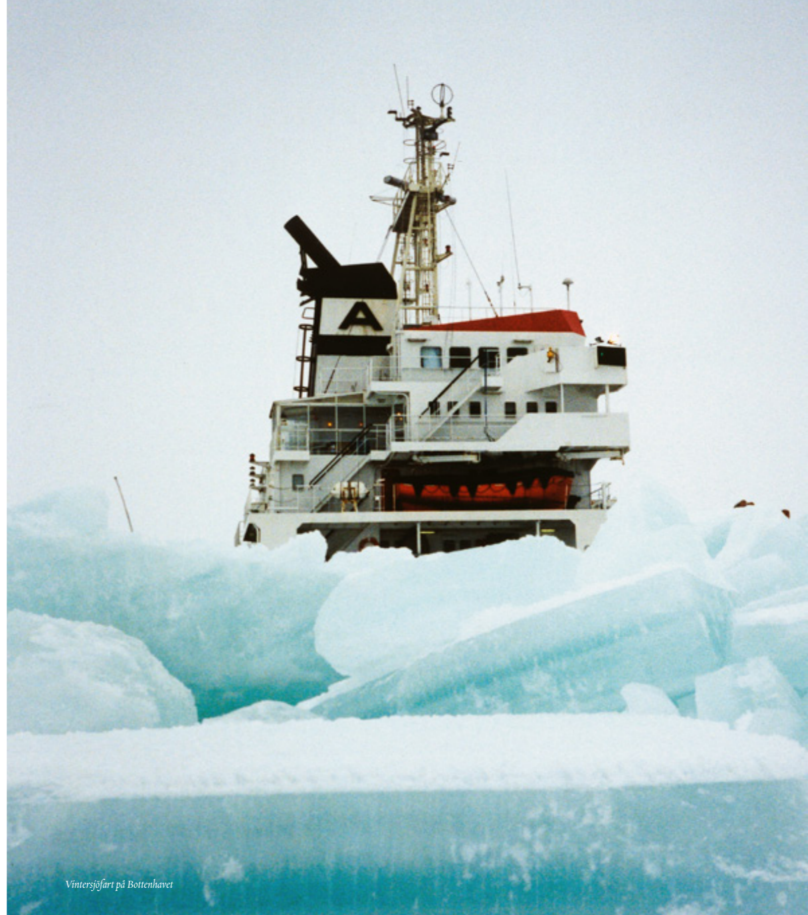
Vintersjöfart på Bottenhavet